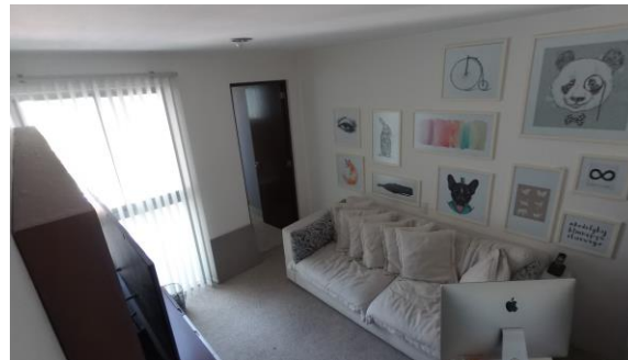
Estudio o recámara de mi bebe

- Todas las recámaras con su propio baño privado.