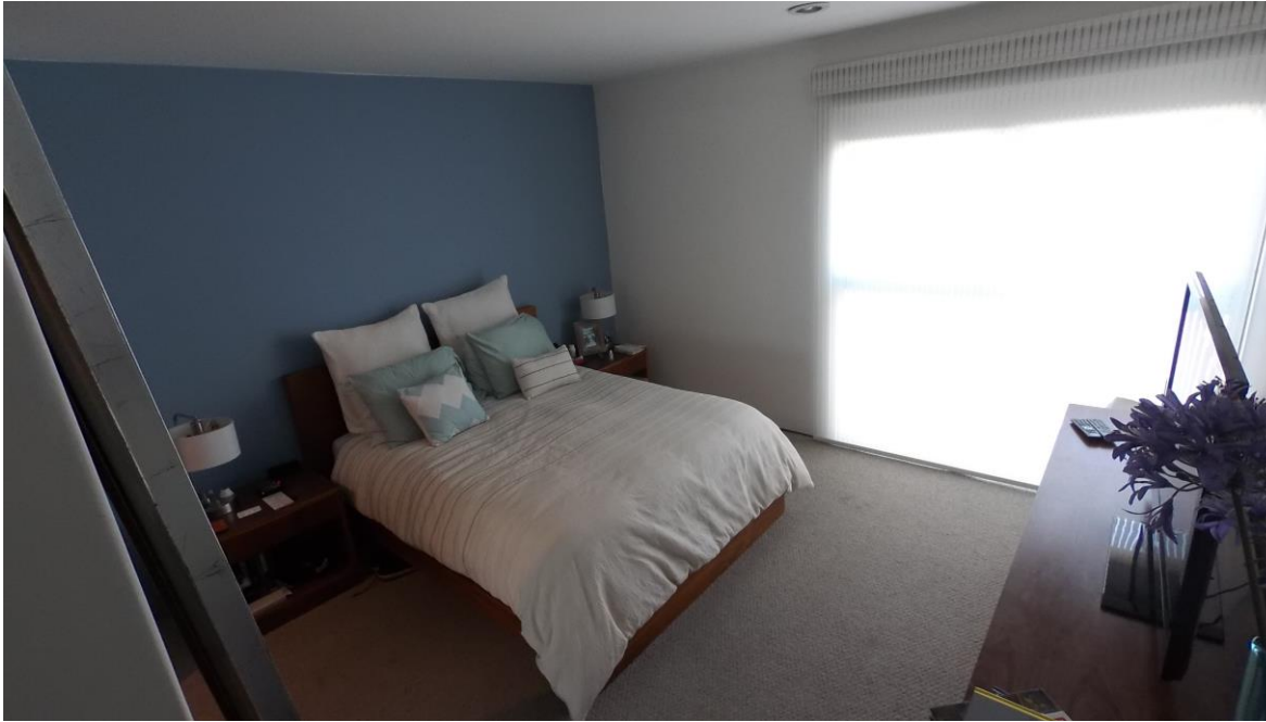
Recámara principal (de los padres)