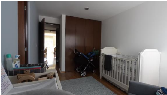
Recámara de mi hijo